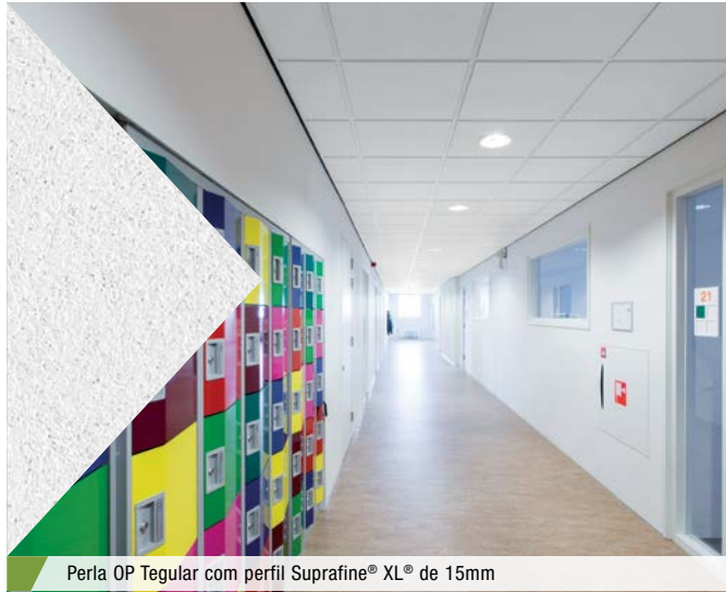
Perla OP Tegular com perfil Suprafine® XL® de 15mm

Os forros Perla OP com textura muito fina apresentam um excelente desempenho de absorção acústica