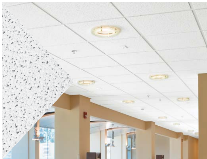
Fine Fissured™ Tegular com perfil XL32 de 24mm

O forro Fine Fissured apresenta uma superfície com textura média e tem uma aplicação flexível