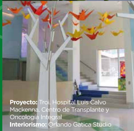
Proyecto: Troi, Hospital Luis Calvo Mackenna, Centro de Transplante y Oncología Integral Interiorismo: Orlando Gatica Studio