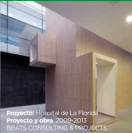
Proyecto: Hospital de La Florida Proyecto y obra: 2009-2013 BBATS CONSULTING & PROJECTS