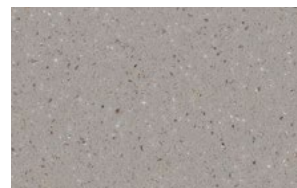
CORIAN® COOL GRAY