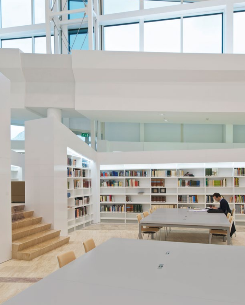
▲ EDUCACIÓN: CORIAN® STRATUS PARA LOS SOBRES DE LAS MESAS.