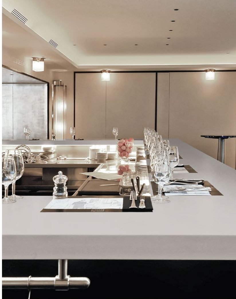
▲ SECTOR ALIMENTACIÓN: CORIAN® STRATUS PARA SUPERFICIES DE TRABAJO.

Corian® Solid Surface with Resilience Technology™ es una solución de prestaciones superiores para una gran variedad de entornos comerciales, como el sector hotelero, el educativo, la sanidad, el sector minorista, el de oficinas y la restauración, además del mercado residencial. Las imágenes muestran algunas de sus posibles aplicaciones.