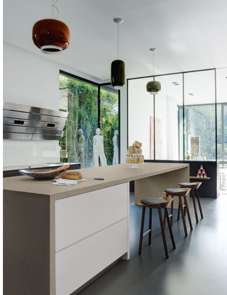
▲ COCINA: CORIAN® KEYSTONE PARA LA ENCIMERA.