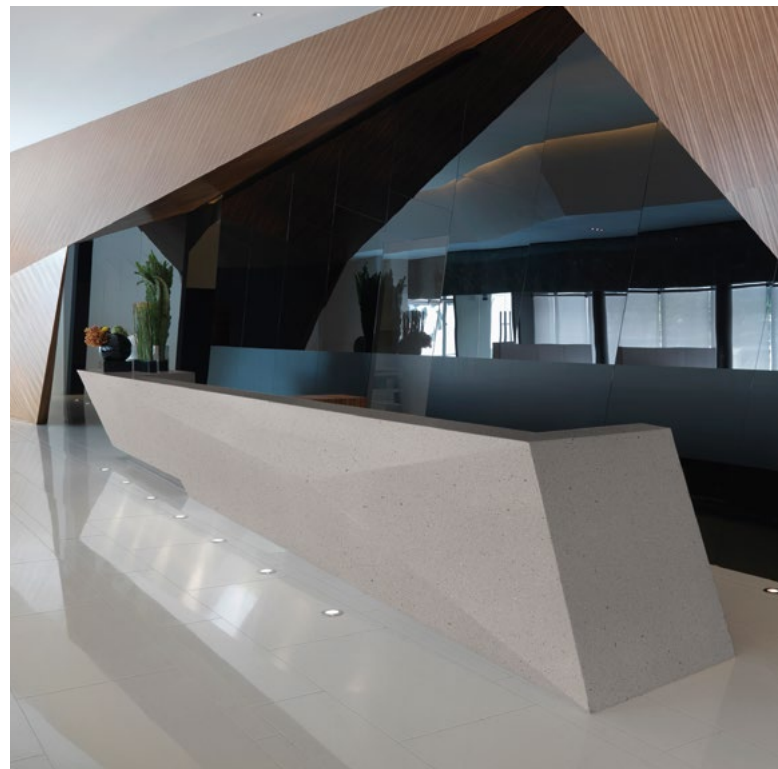
▼ SECTOR HOTELERO: CORIAN® COOL GRAY PARA LA RECEPCIÓN.