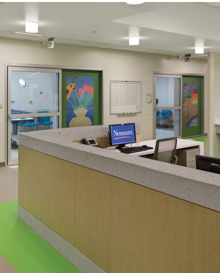
▼ SANIDAD: COLOR CORIAN® COOL GRAY PARA MOSTRADORES DE RECEPCIÓN.