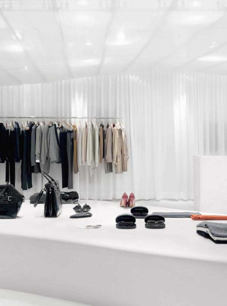
▲ VENTA AL POR MENOR: CORIAN® SUMMIT WHITE PARA MOSTRADORES.