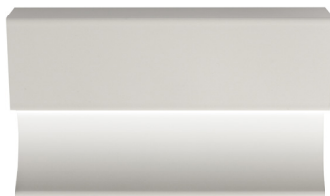
pro-skirting led white