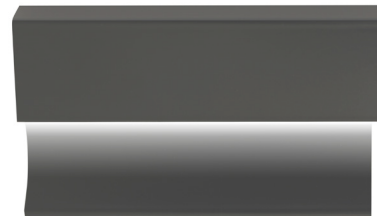
pro-skirting led black