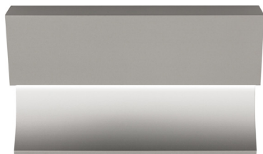
pro-skirting led anodized