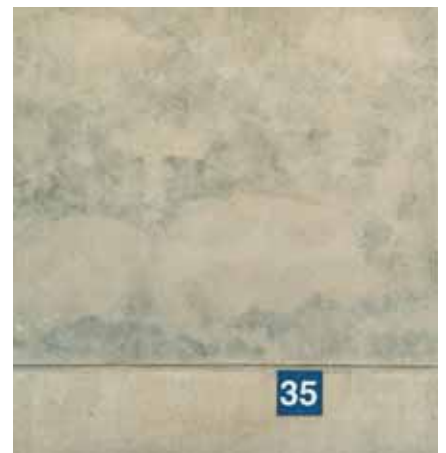
Ejemplo B: Veladura menos diluida