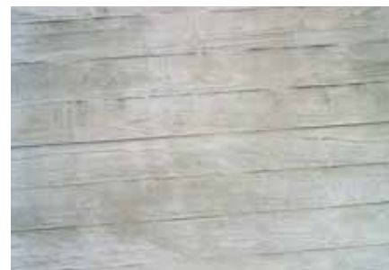
Reproducción de la textura de las tablas de encofrado en zonas reparadas