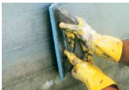
Tendido rascado, aplicado con llana de esponja o de goma dura. Se mantiene la textura de las tablas de encofrado