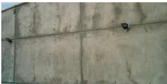
Hormigón nuevo con manchas importantes