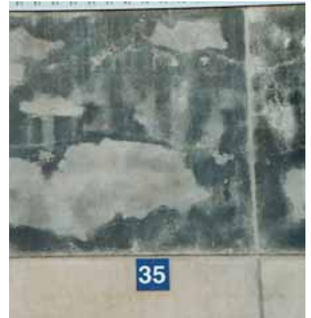
Manchas extremas en la zona de la puerta 35