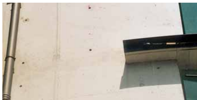
Reducción del impacto visual de los enmasillados e igualación con aspecto mineral