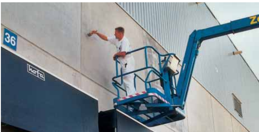
Un técnico de KEIM durante la aplicación