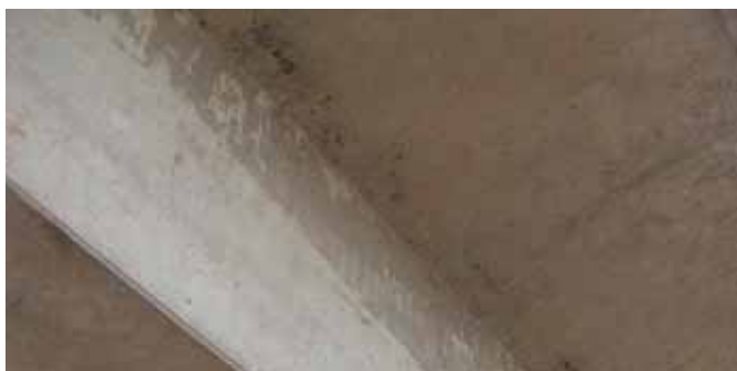
Hormigón nuevo con ligeras manchas