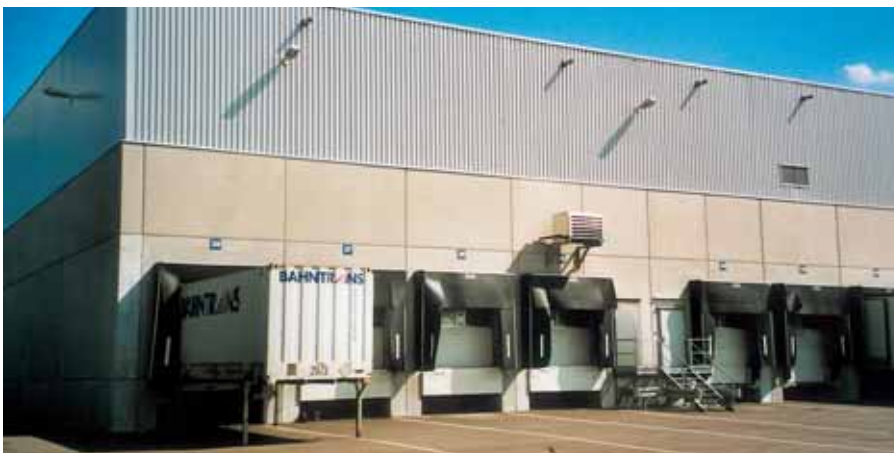
Aspecto homogéneo después de terminado el tratamiento mineral con KEIM Concreta-Lasur