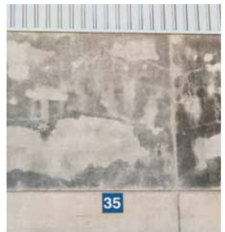
Ejemplo A: Veladura muy diluida