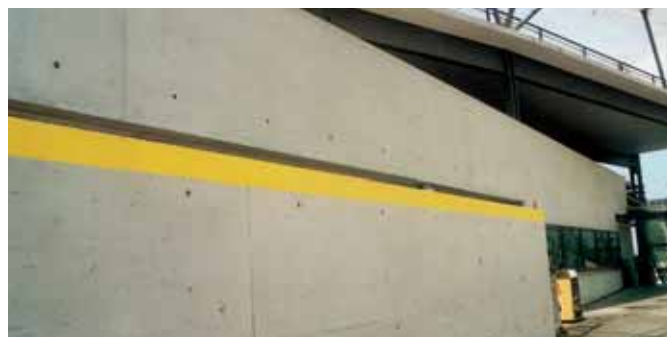
Aspecto mineral homogéneo con KEIM Concretal-Lasur