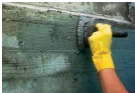
Lechada para cubrir coqueras, aplicada a cepillo, se mantiene la textura basta de las tablas de encofrado