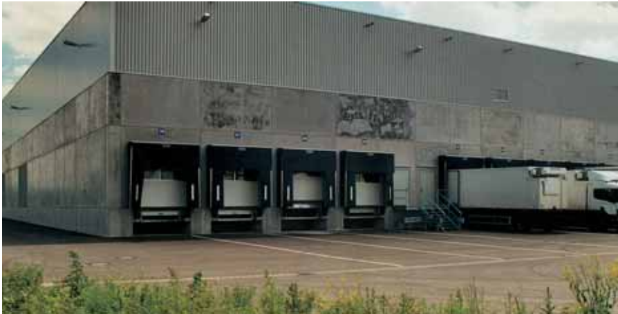
Aspecto inicial irregular y feo

Objetivo: Creación de un aspecto homogéneo igualando los distintos paños según intensidad de las manchas