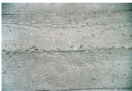
Tratamiento en veladura (sin masilla), las coqueras se mantienen abiertas