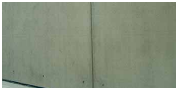
Posibilidad de suavizar notablemente las manchas, o igualación completa con aspecto mineral