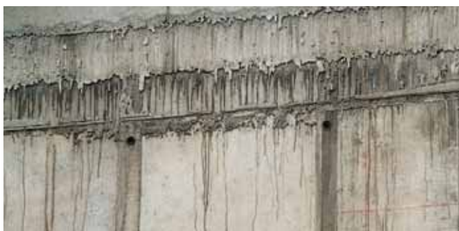
Hormigón nuevo mal ejecutado